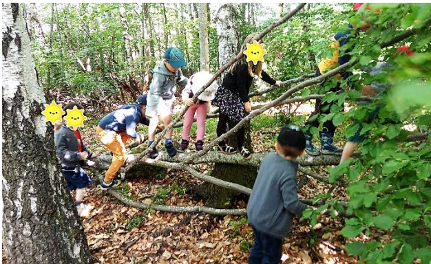
Emilie Ruesch, maîtresse de maternelle

Les enfants et les adultes présents ressortent ravis et grandis de ces expériences !